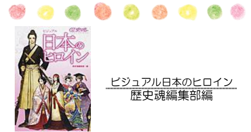
ビジュアル日本のヒロイン 歴史魂編集部編

人気イラストレーターが多数参加! 歴史を動かした女性たちを集めたビジュアル人物図鑑。政治・文化・戦争ささまざまな舞台で輝いた女性たちを収録。